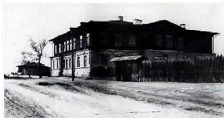
Первая школа, открытая в с.Усть-Абаканское в 1863г.

В 1863 году по решению Абаканской инородной управы в селе Усть-Абаканское было открыто первое учебное заведение на территории Хакасии - одноклассное «Министерское начальное училище» , или оно еще называлось - Павловское инородческое училище, министерская школа.