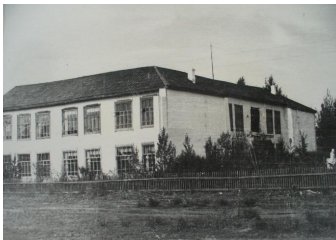
Хакасский сельскохозяйственный техникум

20 декабря 1932 года в городе был открыт Абаканский коневеттехникум, который имел зоотехническое (конеvodческое) и подготовительное отделения, первый набор учащихся составил 72 человека.