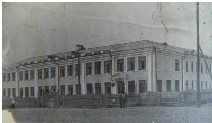
Абаканский педагогический институт, в 1950 годы.

В трудное военное время в городе появились новые образовательные учреждения: хакасская национальная школа-интернат, детская музыкальная школа, Хакасский областной институт усовершенствования учителей (для повышения квалификации и переподготовки), создан Хакасский научно-исследовательский институт языка, литературы и истории.