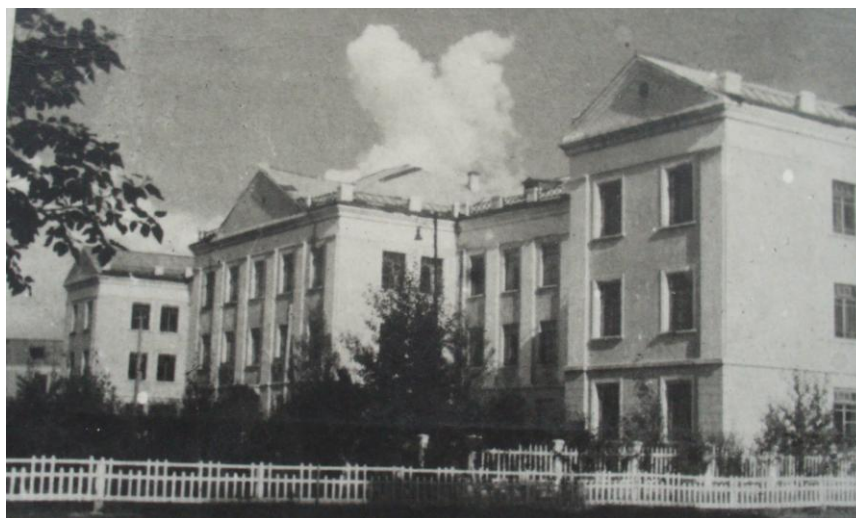
Абаканская Фельдшерско-акушерская школа, в 1950-е годы.

Первого октября 1934 года открылась Абаканская Фельдшерско-акушерская школа , с 1958 года - Абаканское медицинское училище), была создана подготовительная группа, в которой обучалось 35 человек. Наличие подготовительных отделений было характерно для всех средних специальных заведений Хакасии 1930 годов. Комплектовались эти отделения преимущественно из коренной национальности. Первый выпуск был в 1937 году в количестве 24 человек. В 1940 году уже училось 295 человек.