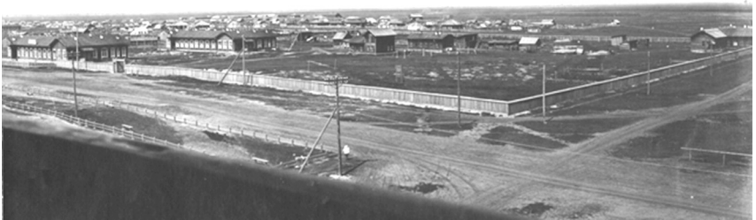
Рис. 2. Областная больница на улице Ленина (слева), за ней хирургический корпус, рядом на территории – кухня, прачечная, хозпостройки, 1933–1934 гг. Из фондов ХНКМ