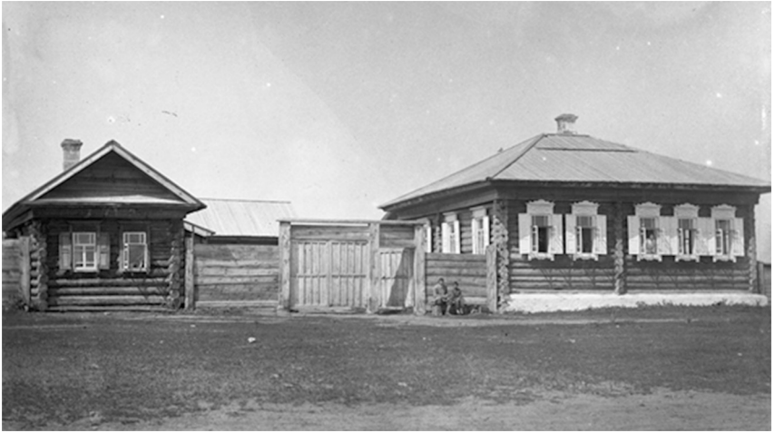
Рис. 1. Лечебница в селе Усть-Абаканском, 1898 г.