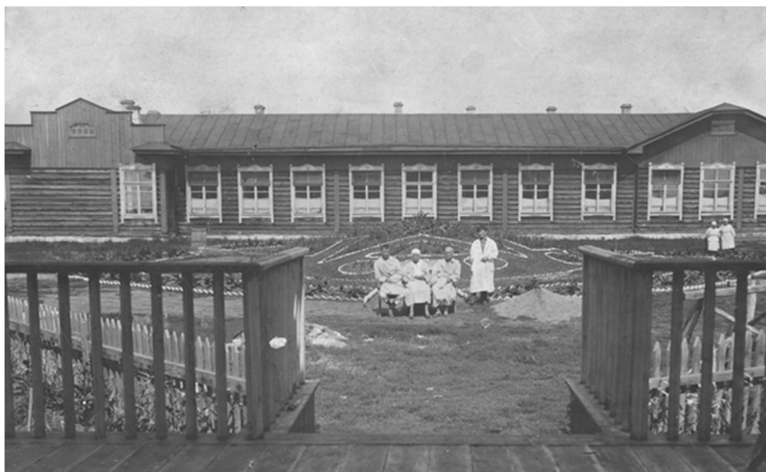
Рис. 3. Хирургическое отделение областной больницы, 1930-е гг.