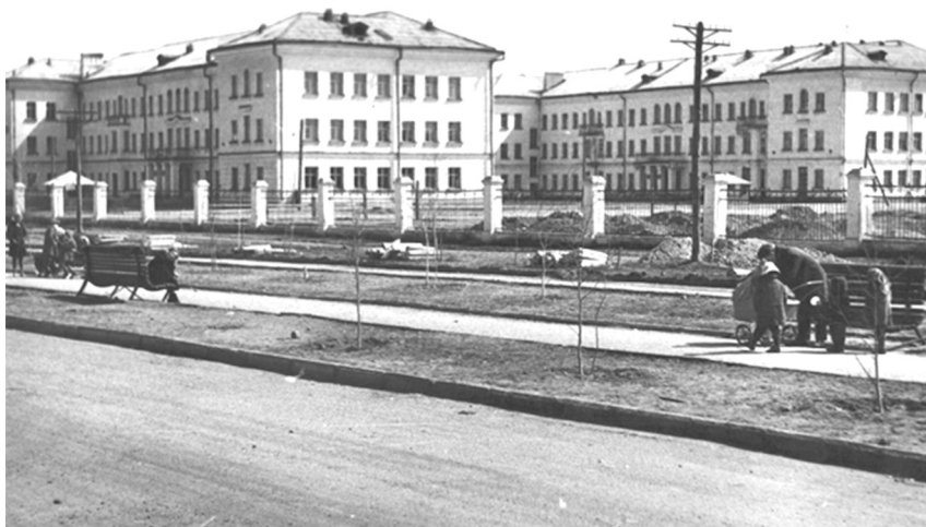
Рис. 4. Новое здание областной больницы, 1960-е гг.