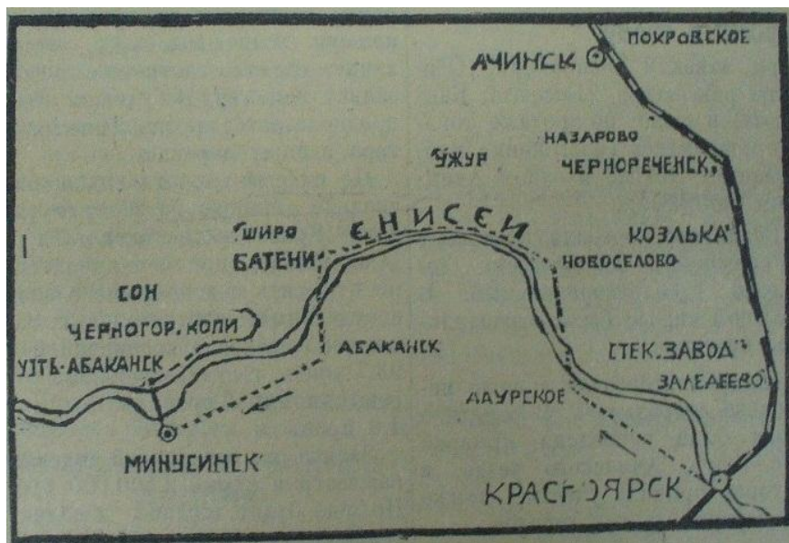
Маршрут полета «Красноярца», 1925 г.

Самолет «Красноярец» побывает в Минусинском уезде в тех деревнях, где можно будет найти подходящие места для спуска самолета, затем посетит станицу Хакассии с. Усть-Абаканск. В обратный путь полетит по линии р. Енисей (Новоселово, Даурское) в Красноярск Таким образом, по сравнению со старым маршрутом отпадают пункты: Ужур, Назарово, Ачинск, Покровское, Чернореченское, Козулька, Кемчуг, Знаменский завод, Заледеево [5].