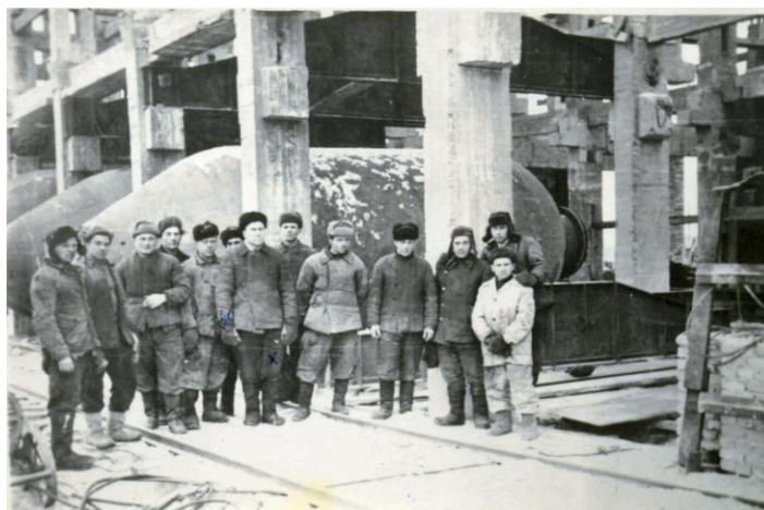
Первые строители гидролизного завода, 1949 г. [1]

Строительство Хакасского гидролизного завода началось в 1949 году на базе Усть-Абаканского лесозавода Черногорского деревоотделочного комбината и Абаканской мебельной фабрики.